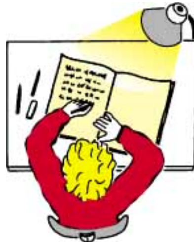
Die richtige Blatt- und Schreibhaltung für Linkshänder

Linkshändige Kinder benötigen keine Sonderbehandlung. Sie haben beim Malen, Zeichnen oder Schreiben auch nicht mehr Schwierigkeiten als rechtshändige Kinder, sie können genauso geschickt/ungeschickt und geübt/ungeübt sein. Aber es gibt trotzdem einige Hinweise zu beachten und auch Möglichkeiten der Unterstützung für Eltern. Achten Sie auf eine richtige Stifthaltung, bei der Ihr Kind den Stift an seinem unteren Ende so zwischen Daumen, Zeigefinger und Mittelfinger fasst, dass die linke Kante seiner Hand auf dem Papier aufliegt. Viele Linkshänder schreiben mit einer bogen- oder hakenförmigen Handhaltung (invertiert). Dies wurde lange Zeit als schlechte Angewohnheit angesehen. Neuerdings ist man jedoch der Meinung, auch eine solche Handhaltung zuzulassen, da vermutet wird, dass sie mit der Lokalisation des Sprachzentrums zusammenhängt. Achten Sie darauf, dass das Heft Ihres Kindes mit der rechten unteren Seite zu seinem Körper hin zeigt.